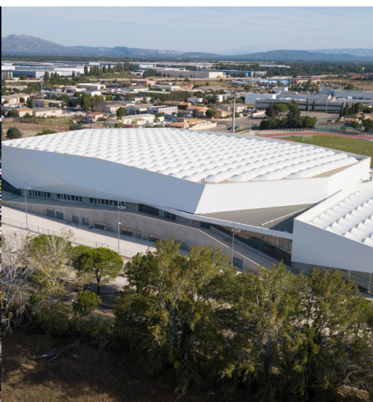
Stadium Miramas Métropole