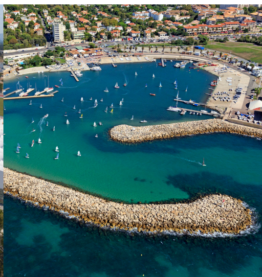
Base nautique du Roucas-Blanc